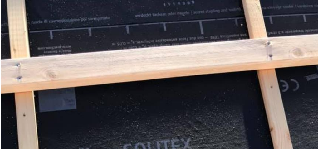
Skýringarmynd: Lektur festingar 2x skrufur í gegnum lektur og í sperrur