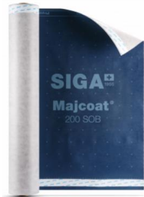
Skýringarmynd: Þakdúkur Siga

Liður þessi felur í sér að leggja til og koma fyrir Siga Majcoat þakdúk (eða sambærilegan dúk) undir þakklæðningu á þak. Þakdúkur festist við borðaklæðningu með heftum. Þakdúkur leggist langsum eftir þakinu og skarist um minnst 250 mm á þversum samskeytum og 100 mm á langsum samskeytum. Fara skal eftir leiðbeiningum framleiðanda við niðurlögn dúksins. Nauðsynlegt er að setja þaklektur samdægurs yfir þakdúk svo dúkur fjúki ekki af borðaklæðningu. Komi slysgöt á þakdúk skulu þau lagfærð áður en þaklektur eru settar niður. Þyngd þakdúks skal vera a.m.k. 200 gr/m 2 og yfirborð pappans skal vera sendið.