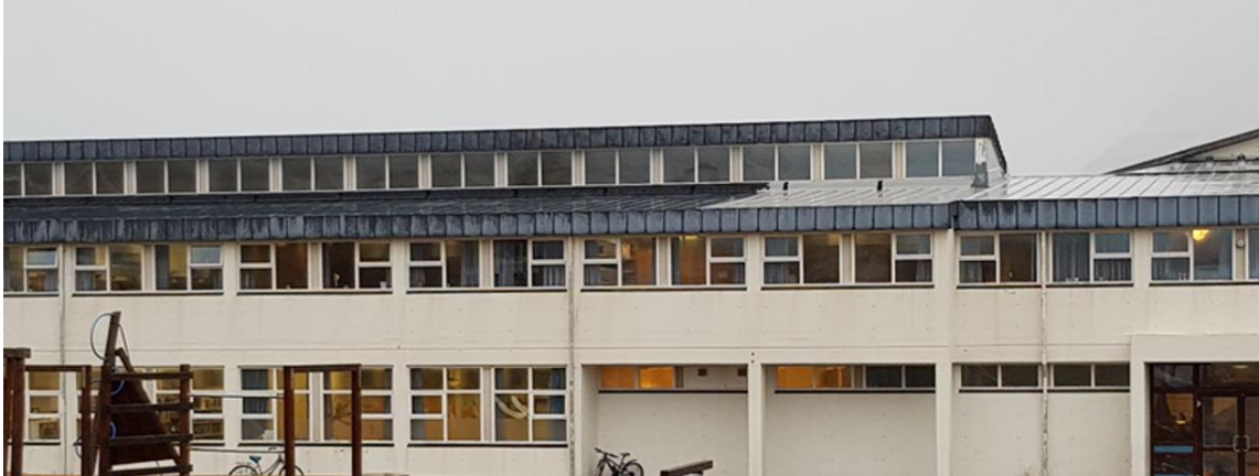
Skýringarmynd: Þakgluggar á þaki

Verktaki skal endurmála timburglugga á efri hluta þaks. Mála skal timbur hvítt að lit með þekjandi málningu (grunnur+2 umferðir).