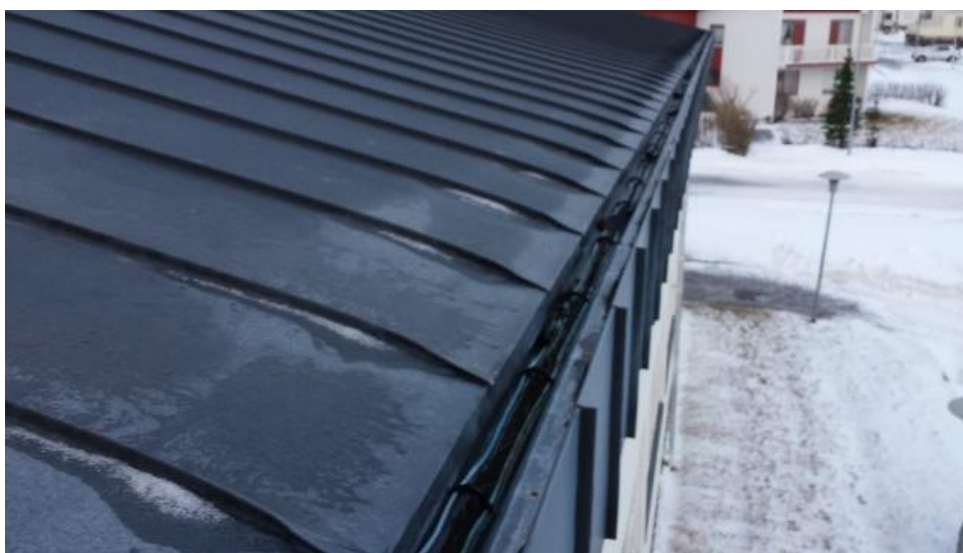
Skýringarmyndir: Neðri brún þaks

ATH. Endanleg mál á áfellum skal taka á staðnum áður en smíði hefst.