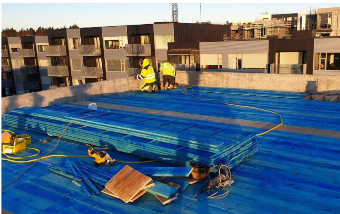
Skýringarmynd: Borðaklæðning mygluvarið (Húsasmiðjan)

Liður þessi felur í sér að leggja til og koma fyrir borðaklæðningu á þak í samræmi við magnskrá. Um er að ræða furuborð 25x150 mm mygluvarið timbur. Klæðningin skal negld í þaksperrur með galvanhúðuðum saum 3,1x75 mm. Borð skulu sett saman á sperrum. Víxla skal samskeytum eins og hægt er. Hvert borð skal ekki vera styttra en 2,6 metrar. Neðsti 1,1 meter á þaki og 1,1 meters breitt svæði við þakbrúnir skal negla með 4 stk 3,1x75 mm heitgalvanhúðuðum saum m/haus í hvert borð og sperru. Borðaklæðning leggst þvert þaksperrur.