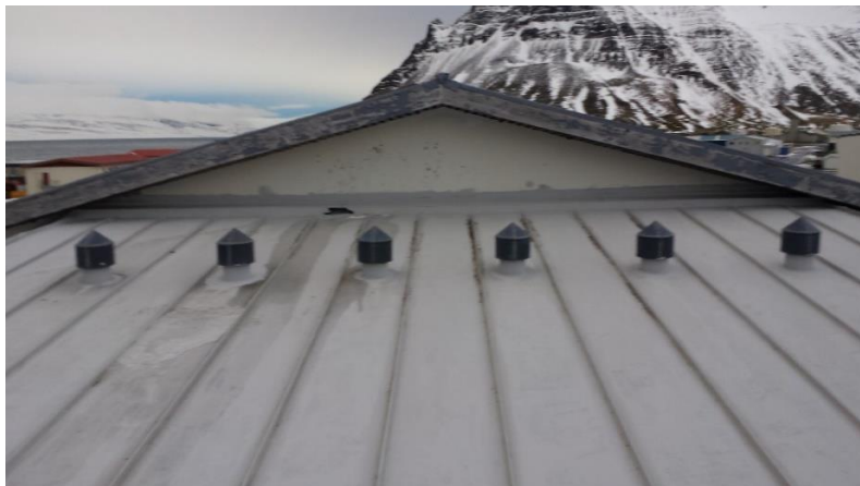
Skýringarmynd: Áfellur við steiptan vegg