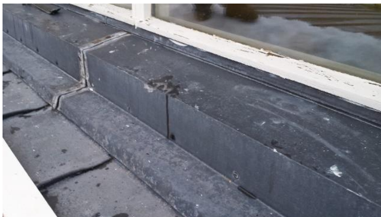
Skýringarmyndir: Þakkantur við glugga neðri þak

Verktaki skal smíða og koma fyrir áfellum á langhlið neðra þaks sem nær undir glugga og út á þakstál á efribrún lærra þaks að lámarki 25 cm. Og skulu vera gráar stáláfellur í sama grúa litnum og nýja bárustálið. Mál áfellu er tekið á staðnum áður en smíði hefst.