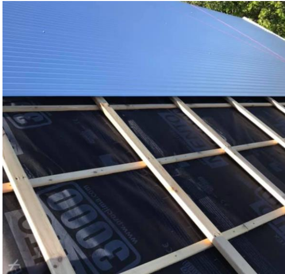
Pakstál á lektuklæðningu